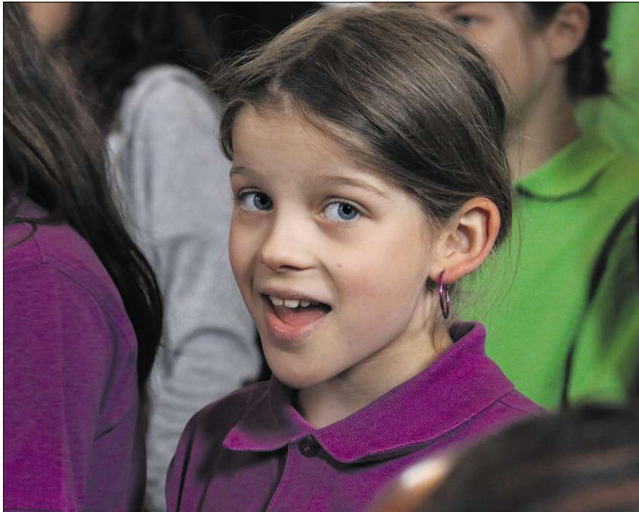
Il plascher dils affons e giuvenils pil cant ei staus nunsurveseivels.

Tgi che ha vuliu veser ed udir ils chors duront quels quater dis ha giu biaras caschuns leutier. Ils chors ein sepresentai els concerts el center da sport e cultura, mo era en baselgias e capluttas e leutier sin piazzas publicas. Las formaziuns derivontas da tuttas regiuns linguisticas dalla Svizra han denton era embelliu survetschs divins. Igl interess per ils concerts e las producziuns sin piazzas publicas ei staus fetg grond. Differentas gadas ein la baselgia parochiala e la baselgia claustrala stadadas pleinas. Mo era la fascinaziun per ils concerts en baselgias pli pintgas e sin las piazzas publicas ei stada gronda. La qualitad musicala da quels chors ei stada per gronda part sin in fetg ault nivel, gie schizun pli aulta ch'avon dus onns a S. Gagl. Quei constatescha il president dalla cumissiun da musica dil festival, Chris-